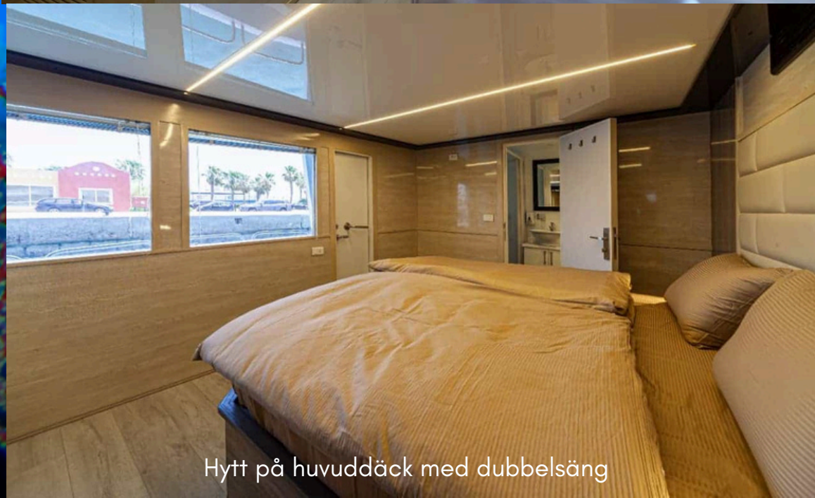
Hytt på huvuddäck med dubbelsäng