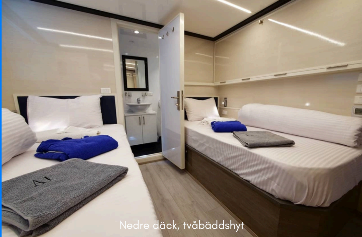
Nedre däck, tvåbäddshytt